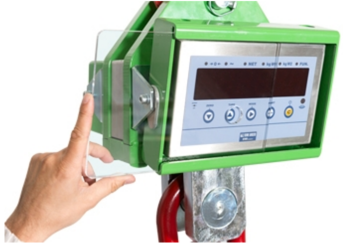
Schutzscheibe aus Plexiglas für Display und Tastatur