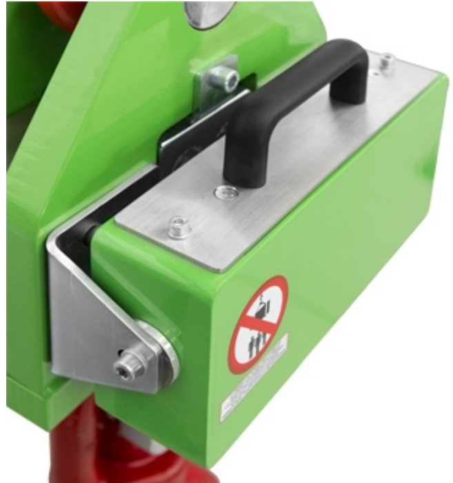
Serienmäßiges austauschbares Batteriefach