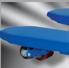
Tandem-Polyurethan-Lastrollen für leicht gängigen und geräuscharmen Transport