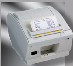
Externer Etikettendrucker mit Etikettenspender