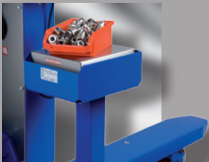
Referenzwaage zur schnellen und präzisen Ermittlung des Referenz- gewichtes von leichten Teilen